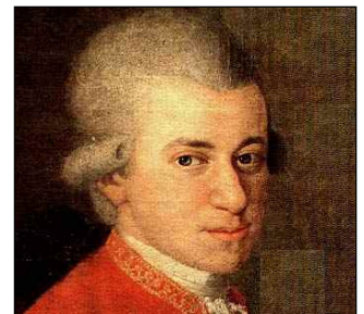
J. N. della Croce - Bildnis Familie Mozart, t 1780/81, Ausschnitt