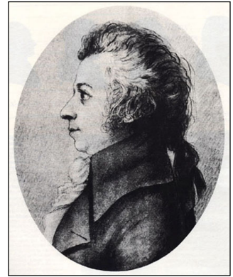
Doris Stock - W. A. Mozart Silberstiftzeichnung, 1789