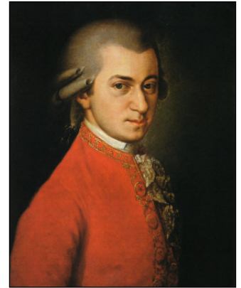
Barbara Krafft - Bildnis W. A. Mozart, 1819

Ich bin davon überzeugt, ein außerordentlich lebensnahes Porträt Mozarts geschaffen zu haben, das hohen künstlerischen Anforderungen genügt und den Betrachter sofort anspricht.