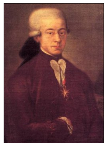
Anonym - Bildnis W. A. Mozart als Ritter vom goldenen Sporn, 1777