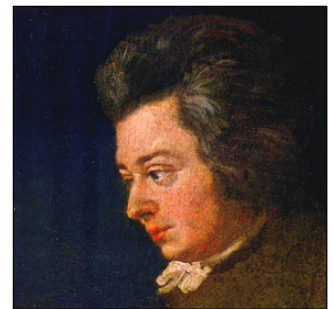
J. Lange - Bildnis W. A. Mozart (unvollendet), 1782, Ausschnitt