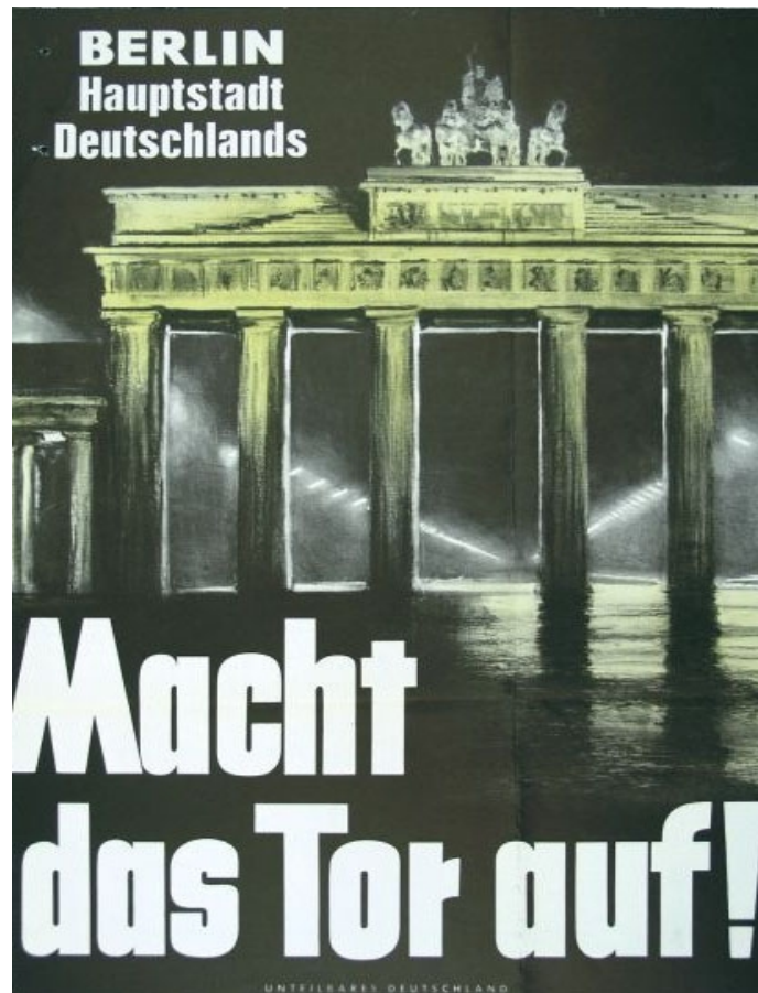
Plakat des Kuratoriums Unteilbares Deutschland, 1959

Passage. Diese Verbindung wurde sprichwörtlich in Richard von Weizsäckers oft zitiertem Diktum, die deutsche Frage bleibe so lange offen, wie das Brandenburger Tor geschlossen sei.