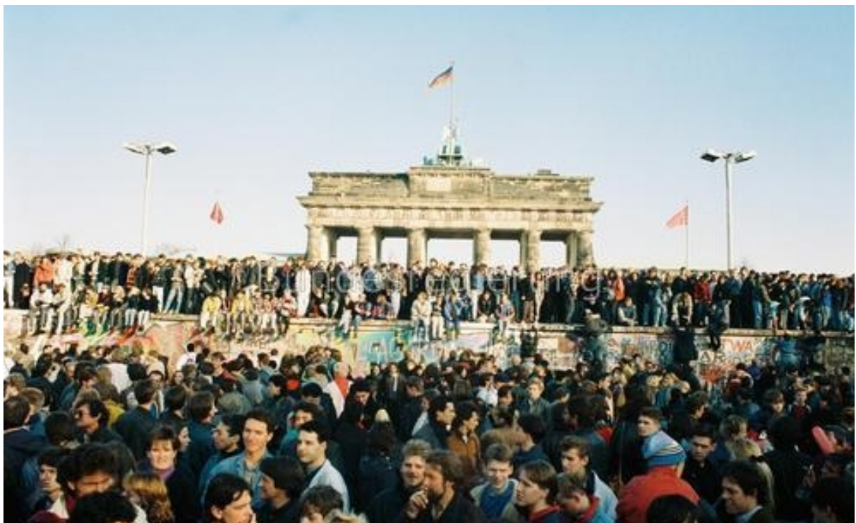
Bewohner aus beiden Teilen Berlins auf der Mauerkrone am 10.11.1989

Wie kaum ein anderes Ereignis der jüngsten deutschen Geschichte wurde der Fall der Mauer am Abend des 9. Novembers 1989 unmittelbar als «historisch» erfahren. Mehr